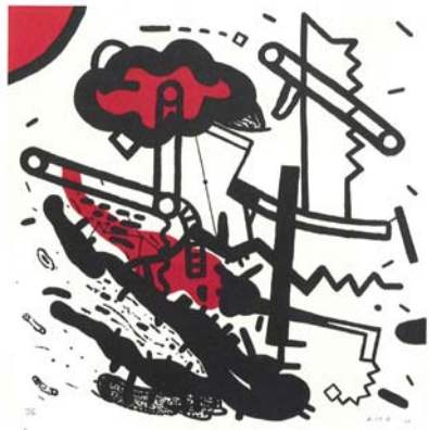
The Paris Suite IX , 2007, Lithographie sur BFK Rives H 54 x L 54 cm, Item éditions, Paris © David Lynch