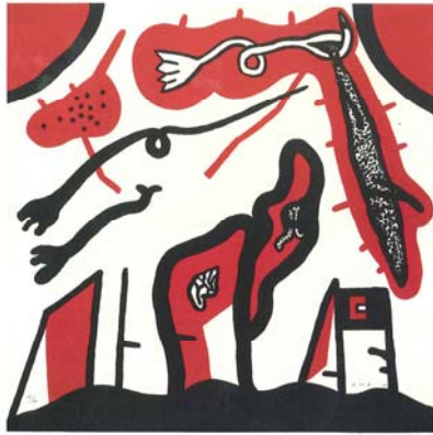
The Paris Suite VII , 2007, Lithographie sur BFK Rives H 54 x L 54 cm, Item éditions, Paris © David Lynch